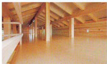
3階の屋根裏部屋と3階への手造り板階段

壁全体にスジカイ + 斜めに桧板を打ち付けて耐震性は品確法等級3の最高ランクです。