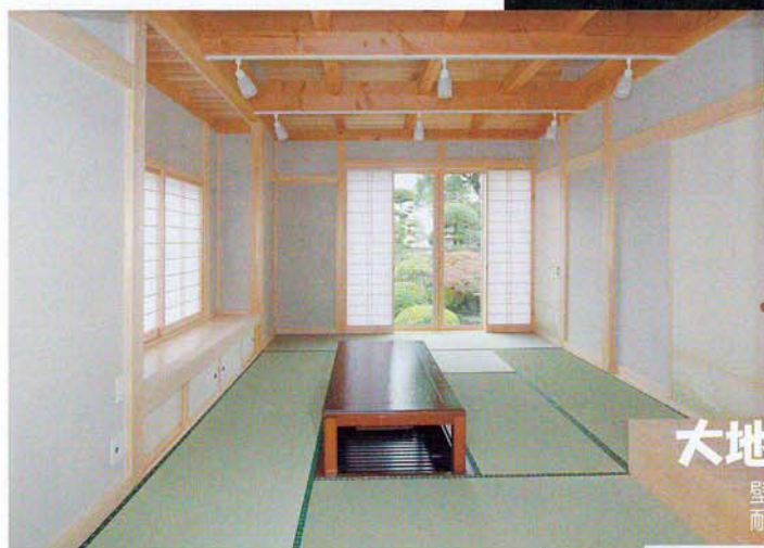
開放感ある吹抜けに梁が見える和室の茶の間

「一年中快適に暮らせる家」をテーマに、人と自然にやさしい「無垢材」をふんだんに使用した外張り断熱で伝統の木造在来工法と差し鴨居工法をも取り入れているところが大きな特徴です。この度、施主様のご好意により開催します。是非一度、お越しください。