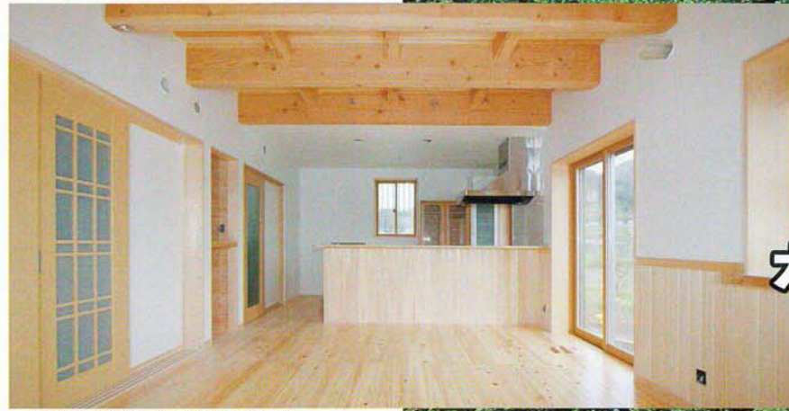
桧の床板・腰板、梁が松のリビング

外張り断熱で「在来工法」の家を時間をかけてゴツゴツと仕上げました。 土台・柱は含水率18%以下で、強度計算済印のある超優良な国産材 無垢の桧4寸角を使用しています。(集成材は使用しておりません)