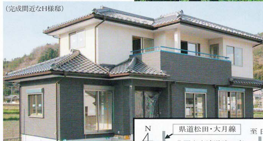
重厚なタイル張りの外観