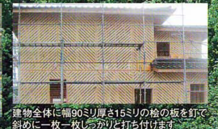
建物全体に幅90ミリ厚さ15ミリの桧の板を釘で斜めに一枚一枚しっかりと打ち付けます