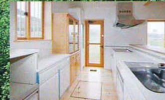
IHでお洒落なキッチン