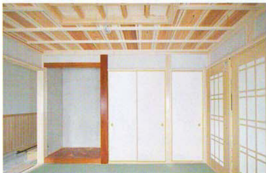
落ち着きのある全て無垢の和室