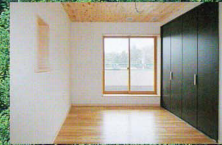
全て無垢板仕様の子供部屋