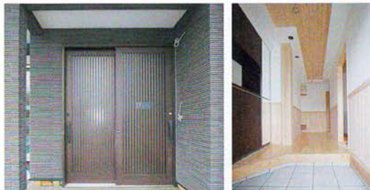
北海道仕様の断熱引き違いサッシ 大黒柱とケヤキの玄関