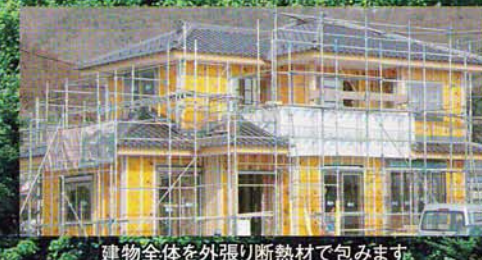
建物全体を外張り断熱材で包みます