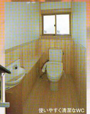
使いやすく清潔なWC