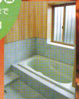
檜の香りいっぱいの無垢檜風呂

早いもので、見学会も53回目を開催させていただきます。北海道の家はどうして涼しいのか今回の完成見学会をご覧いただければご理解出来ます。そして私の持っている建築の力を十分に発揮した建物であると自信を持っております。