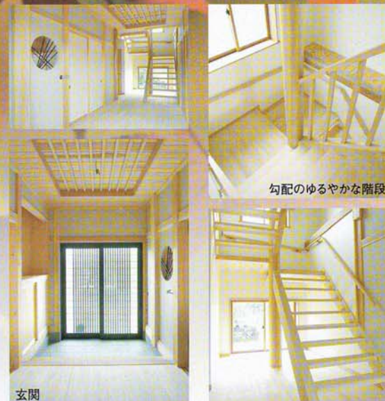
勾配のゆるやかな階段

ベニヤ合板や集成材の 土台・柱・梁は一切使わず 無垢材で時間をかけて じっくり造り上げました。