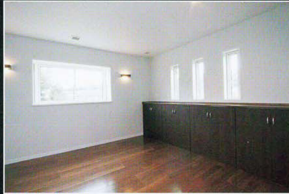
落ち着いたある2Fの寝室。収納が豊富