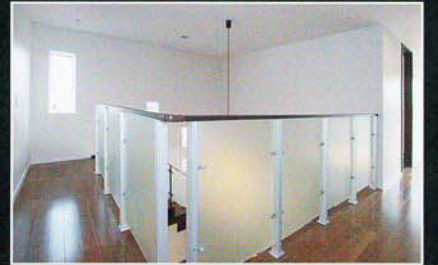
2Fの明るく安全な吹抜け手摺り