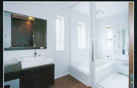
斬新な手造りで、明るい浴室