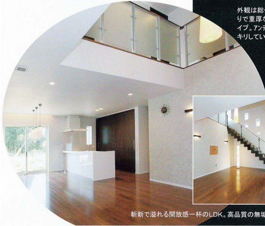
斬新で溢れる開放感一杯のLDK。高品質の無垢材で仕上げました。

渡辺工務店は17年前から外張り断熱で冬暖かく、夏涼しい家を作っています。人は暖かい家で暮らすと顔つきが穏やかになります。断熱性能:Q値1.0 W/mik クラス。換気・第1種熱交換を使用