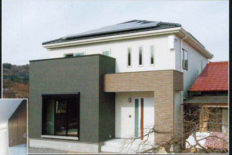
屋根は三州瓦、太陽光発電を設置してエコと災害時に備えます。サッシは断熱効果の高いLow-Eアルゴンガス入りを使用