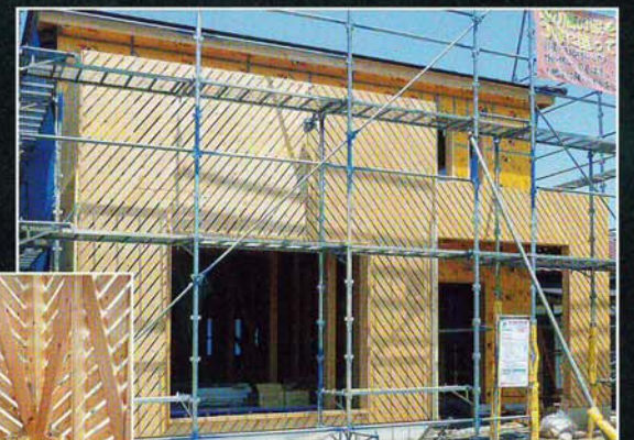
足利には築数百年の建物は多数あります。全てに頑丈な家です。

渡辺工務店は、安全と安心の(財)住宅保証機構の完成保証(第1種)・瑕疵10年保証の登録店です。